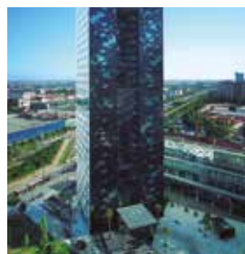
BARCELONA Renaissance Fira

Pl. d'Europa, 50-52 Tlf: +34 932 61 80 00