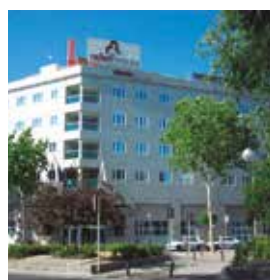
MADRID Rafael Atocha

4 Rue Reine Astrid Tlf. +33 5 62 41 41 41