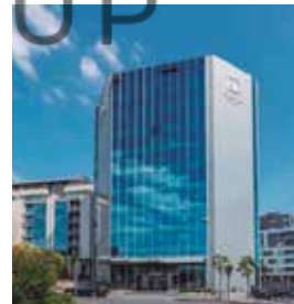
SANTIAGO Gran Santiago

Av. de Rosalía de Castro Tlf: +34 981 79 52 99