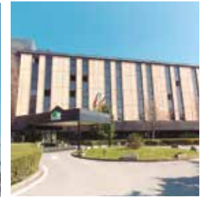
VENECIA (Mestre) Belstay

Av. do Mestre Mateo, 27 Tlf: +34 981 53 42 22