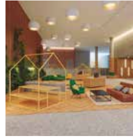
PARIS H4 Pleyel

216 Av. Jean Jaurès Tlf: +33 1 44 84 18 18