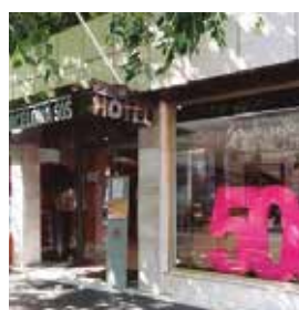
BARCELONA Catalonia 505

Pº de la Mare de Déu del Coll, 10 Tlf: +34 932 19 12 04