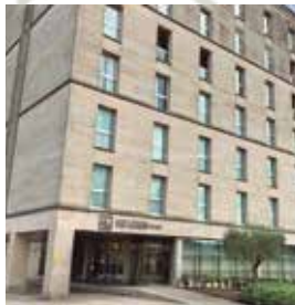
SANTIAGO Eurostars San Lazaro

Av. Fernando de Casas Novoa, Tlf: +34 981 55 10 00