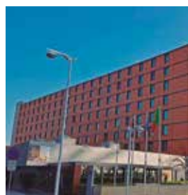
LISBOA Vila Galé Ópera

Robert-Bosch-Straße 26 Tlf: +49 6103 9720