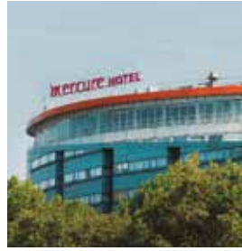
PARIS Mercure Philharmonie

Rue Albert Caquot Tlf: +33 4 92 96 04 04