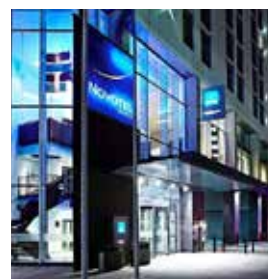
LONDRES Novotel Excel

Royal Victoria Dock, 7 Tlf: +44 20 7660 0677