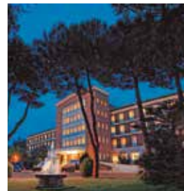
ROMA Green Park Pamphili

Largo Lorenzo Mossa, 8 Tlf: +39 06 66441