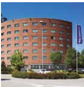
VENECIA (Mestre) Novotel Castellana

Via Alfredo Ceccherini, 21 Tlf: +39 041 506 6511