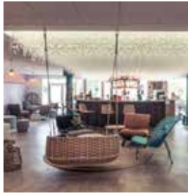
NIZA (Antibes) Mercure Antipolis

108 Bd René Cassin Tlf.: +33 892 23 36 63