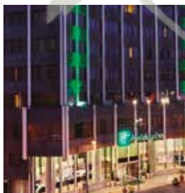
LISBOA Holiday Inn Lisbon

Tv. do Conde da Ponte, 1300-141 Tlf: +351 21 360 5400