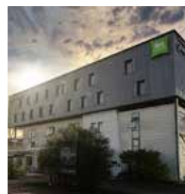
BURDEOS Ibis Styles Begles

Pl. d'Europa, 50-52 Tlf: +34 932 61 80 00