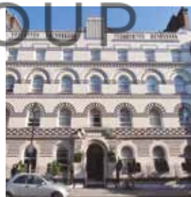
LONDRES Langham Court