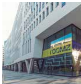
VIENA Roomz Prater

Mariahilfer Straße 122 Tlf: +43 1 525850