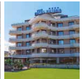
SANTANDER Gran Victoria

Largo Lorenzo Mossa, 4 Tlf: +39 06 661028