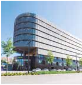
NIZA B&B Arenas

108 Bd René Cassin Tlf.: +33 892 23 36 63