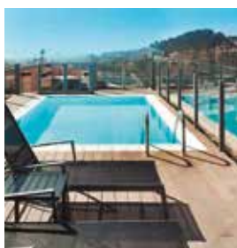
BARCELONA Catalonia Park Güell

Pº de la Mare de Déu del Coll, 10 Tlf: +34 932 19 12 04