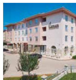
MEDJUGORJE Medjugorje & Spa

C. de Antonio López, 65 Tlf.: +34 914 69 06 00