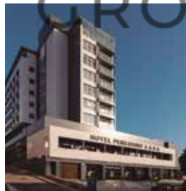
SANTIAGO Exe Peregrino

Av. Fernando de Casas Novoa, Tlf: +34 981 55 10 00