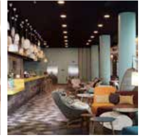
PARIS Hampton by Hilton Clichy

149 Bd Anatole France Tlf: +49 341 98389386