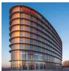
AMSTERDAM Intercity Airport